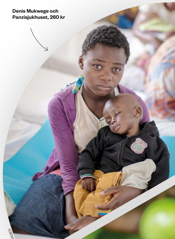
Denis Mukwege och Panzisyjukhuset, 260 kr

åka till Burundi och hälsa på ett missionärspar. Tillsammans med dem fick jag se olika delar av deras arbete, t ex byggande av en skola i byn där de bodde. Men en av de största upplevelserna under resan var att följa med till ett barnhem och få möta dessa söta små barn. Jag kan säga att jag ville ta med allihop hem! Det arbete som Give a Child a Family gör i Sydafrika är helt fantastiskt och jag tipsar helhjärtat om denna julklapp!