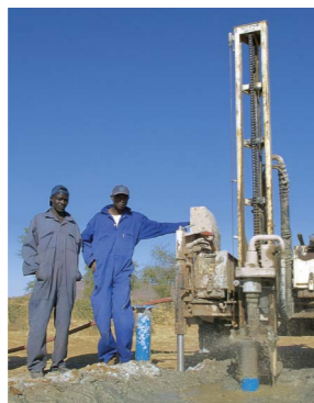
2009 förlorade Läkarmissionen dyrbar borrtrrustning i Sudan.

För tolv år sedan förlorade Läkarmissionen dyrbar borrtrrustning i Sudan.