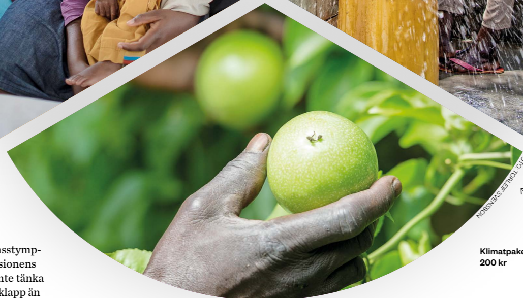
Klimatpaketet, 200 kr