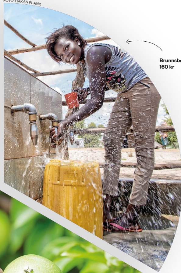
Brunnsborrning, 160 kr